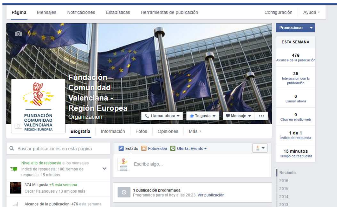
Home de la Página Facebook FCVRE

Durante el 2015 se han ido realizando publicaciones asiduamente, con un total de 132 entradas en Facebook y 374 seguidores.